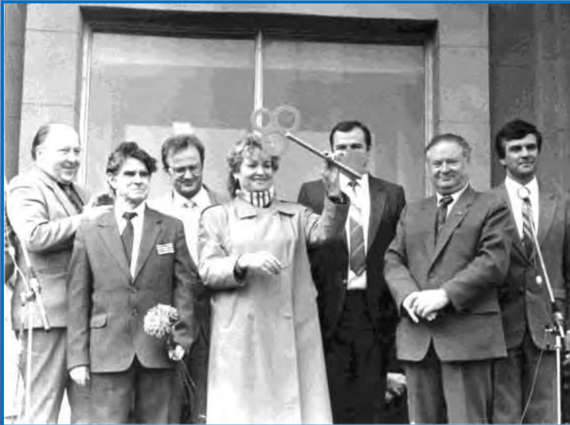
Церемония открытия первого учебного корпуса № 1 БГПУ (1991 г.)