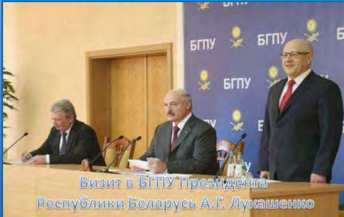
Визит в БГПУ Президента Республики Беларусь А.Г. Лукашенко

21 ноября 2014 г. – встреча Президента Республики Беларусь А.Г. Лукашенко со студентами и преподавателями БГПУ в День 100-летия университета